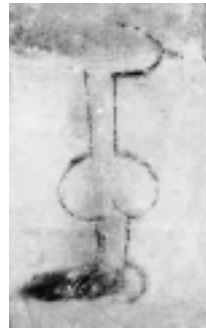
Foto 1: Uitbreiding karbonade-fabriek

Al zijn het hier geen mensen, sommige mensen zijn soms wel varkens!