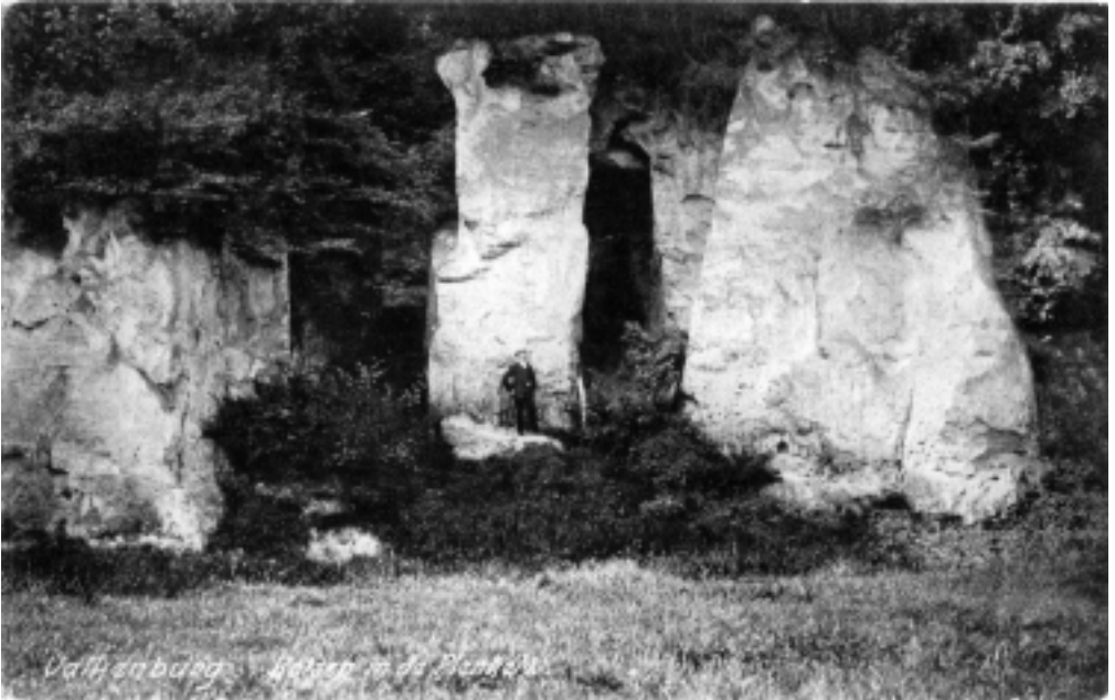
(Valkenburg. Rotsen in de Plenkert 1916. Eigen verzameling)

Aan de Plenkertstraat in Valkenburg liggen aan de linkerkant, even na het oude protestants kerkje, thans Grieks restaurant, een paar grotingangen. Deze zijn zeer oud en vormen samen de toegang tot de Plenkertgroeve.